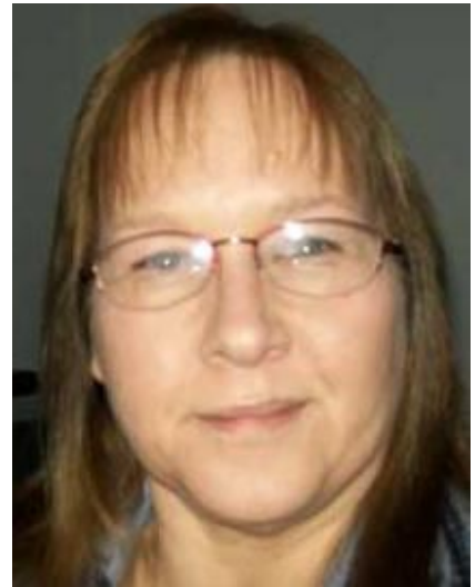
Après le MMS: