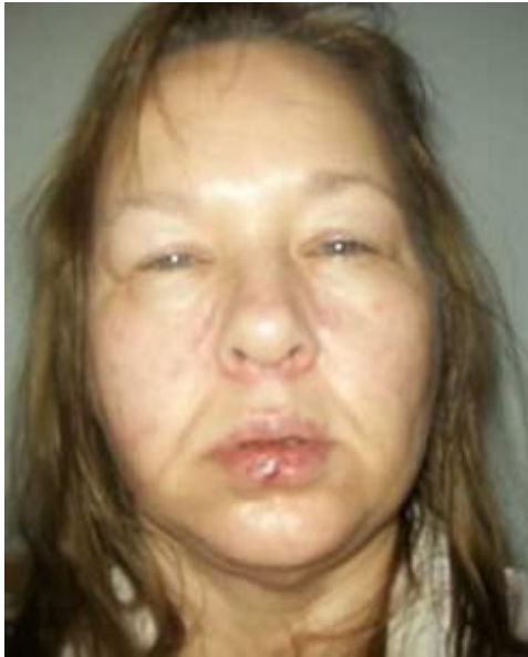
Avant le MMS: