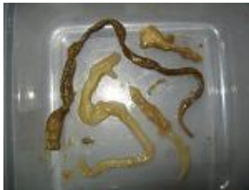
Certains des parasites: