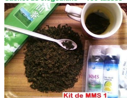
Sachet de Jiaogoulan = 100 tasses

Une petite cuillère de feuilles par tasse , infuser 3 à 5 minutes. Le Jiaogoulan n'est pas amer et s'adoucit au fil de l'infusion. Buvez 4 à 8 tasses par jour pendant au moins trois mois. Les premiers effets sont souvent dès la première semaine . Il est bon aussi de manger les feuilles après infusion ou sèches.